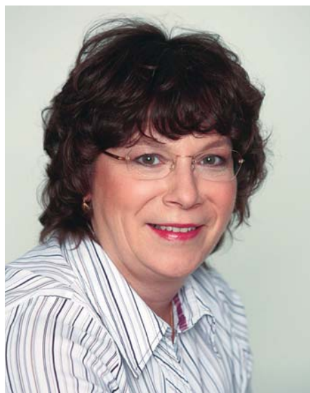
Žena, která se neztratí

Jak to vidí potkani, to opravdu netuším. Nicméně je jasné, že potkan se sám od sebe nepřezírá, pokud však nemá například nějakou poruchu v genech regulujících příjem potravy. Stresem však u něj hypertenzi navodit můžeme. Všechno jsou to faktory prostředí, které můžeme do určité míry ovlivnit, na rozdíl od faktorů genetických, které máme dané.