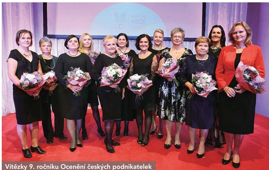
Vítězky 9. ročníku Ocenění českých podnikatelek

Projekt Ocenění Českých Podnikatelek, který zviditelňuje úspěchy českých žen, představil začátkem listopadu vítěze 9. ročníku. České podnikatelky získaly ocenění ve třech kategoriích podle velikosti firmy a také tři speciální ocenění pod patronací generálního a hlavních partnerů projektu. OCP bylo založeno v roce 2008 a jeho cílem je podpora českých podnikatelek.