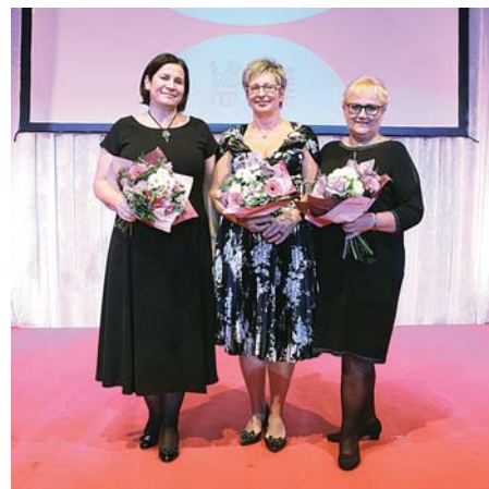
Vítězky kategorie Velká společnost