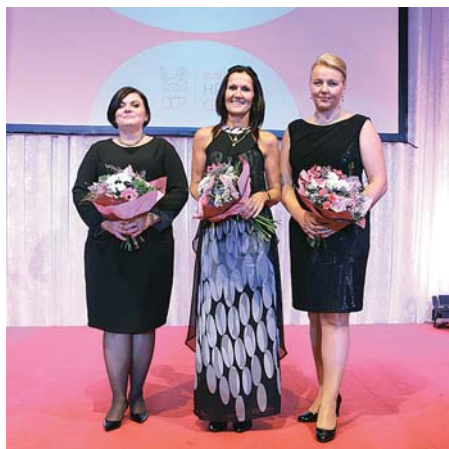
Vítězky kategorie Středně velká společnost