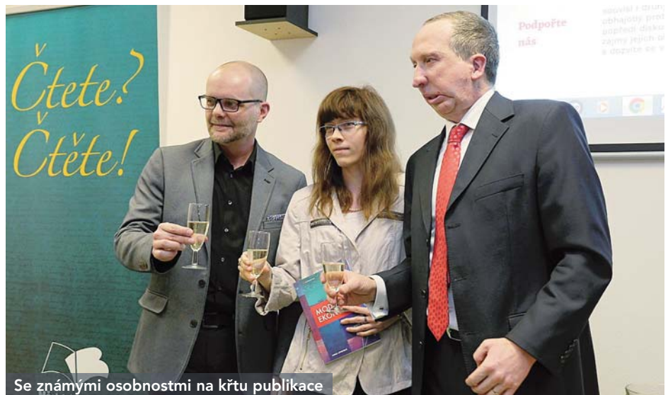
Se známými osobnostmi na křtu publikace

Dokonale a neekonomicky si čistím hlavu hlavně u hudby. Jednak sama hraji na klavír a na varhany, jednak poslouchám klasickou hudbu ve všech formách. Pokud je to jen trochu možné, ráda chodím na koncerty Filharmonie Brno – i proto by mým velkým přáním bylo, aby se Brno po desetiletích konečně dožilo důstojného koncertního sálu. Snad se nám