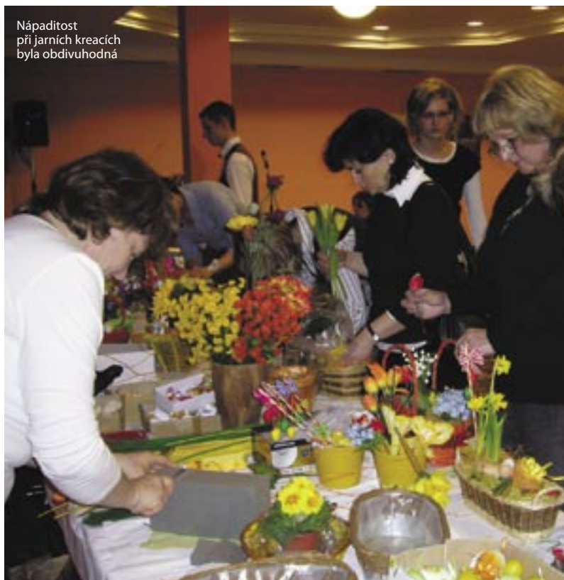
Nápaditost při jarních kracích byla obdivuhodná