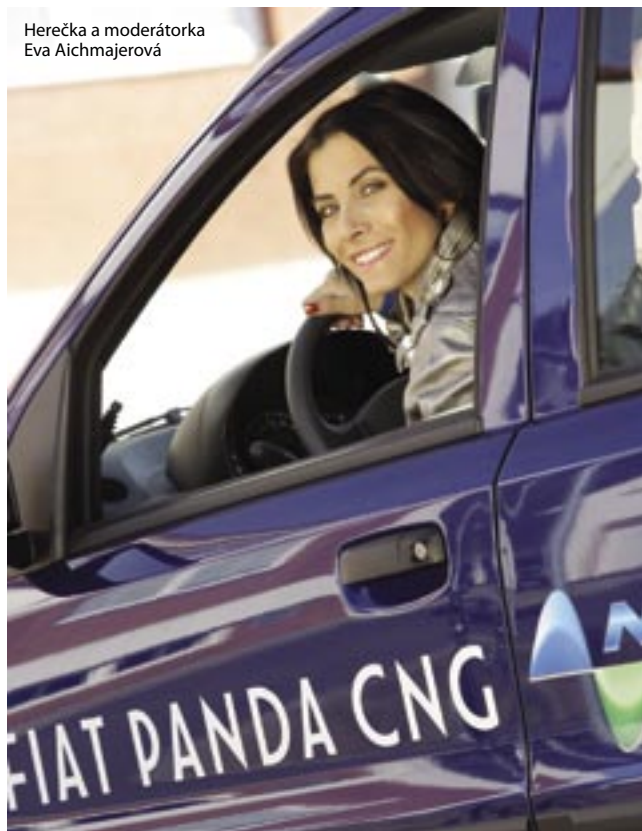
Herečka a moderátorka Eva Aichmajerová

oproti ceně stávajících pohonných hmot. Od 1. 1. 2007 platí nulová spotřební daň na CNG. V současné době je uživatelům zemního plynu v dopravě k dispozici 18 veřejných plnicích stanic a do roku 2013 se předpokládá výstavba dalších. Cílem k roku 2020 je nahradit celkem 10% kapalných paliv v dopravě, což představuje roční prodej zemního plynu ve výši 600–800 mil. m 3 a okolo 350–450 000 CNG vozidel, pro které by mělo být k dispozici v ČR 300–400 plnicích stanic.