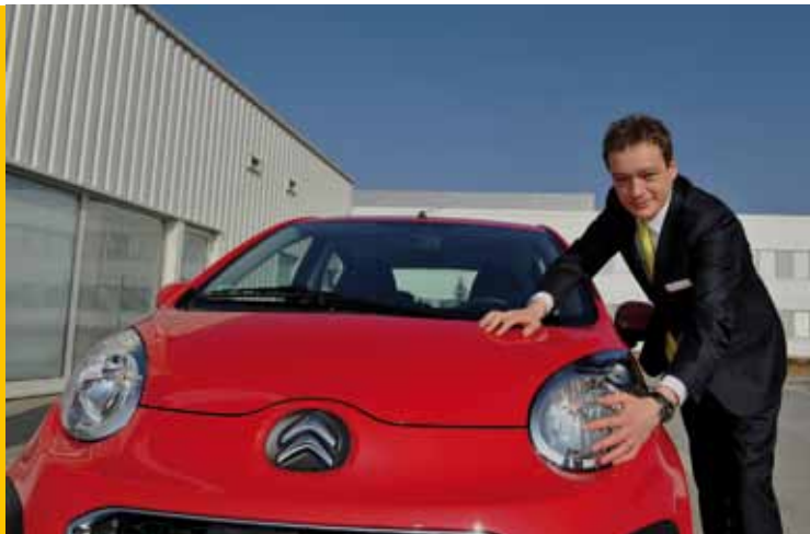
Nový Citroën nám v areálu TPCA ukázal sám ředitel společnosti Citroën Česká republika Sébastien Vandelle

a dveřích. Objem zavazadlového prostoru může uživatel změnit díky sklopitelné zadní lavici a kromě běžných 139 litrů (objem pod krytem zavazadlového prostoru) nabízí pak více než 700 litrů. Agilní a ekologický nový Citroën C1 je nabízen s benzinovým tříválčovým motorem s výkonem 68 k. Hravý nový Citroën C1 se pyšní novým odstínem karoserie, vlastním pouze značce Citroën, který se objevil již u vozů Citroën C3 a Citroën DS3: modrá Boticelli. Modrásku na silnicích hodně nevidáte, ale je to barva, kterou zaručeně nepřehlédnete. Doplnuje nabídku pro rok 2012, jež dále zahrnuje matné i metalické odstíny, jako je červená Scarlett, žlutá Tritium, modrá Electra, bílá Lipizan, černá Caldéra a dvě šedé (jedna světlá: Gallium a jedna tmavá Carlinite). Maska chladiče nové C1 je již od úrovně Comfort opatřena chromovanou lištou. Je to auto pro mnohostranné využití. Došlo k vylepšení jízdních vlastností, a to díky dokonalejšímu fungování posilovače řízení a tlumičům, které zajišťují větší živost a kvalitnější