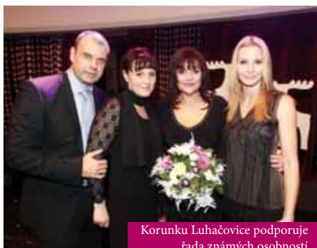
Korunku Luhačovice podporuje řada známých osobností

ROYAL SPA je rodinnou firmou. Proto se ode mě ani neočekávalo, že bych se do podnikání