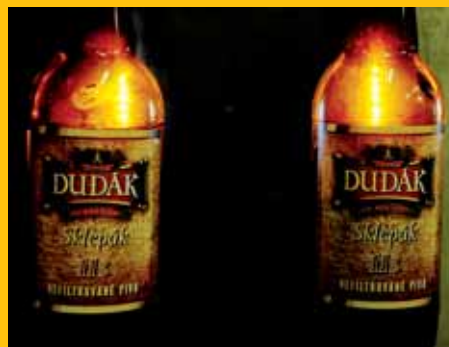
Pivo Sklepek je stále ručně stáčeno, což je v dnešní době spíše raritou

Je to jednoznačně právě Klostermann, ale protože jsou naše piva vařena ze 100% sladu a žateckých chmelů, vykazují i přes