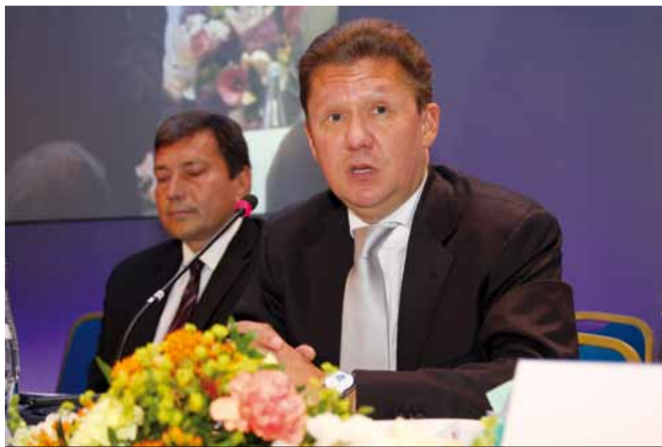
A. B. Miller, prezident EBC, předseda představenstva a generální ředitel společnosti Gazprom

ního plynu (LPG), a to především pro těžké nákladní automobily, a také syntetického diesellového paliva GTL (gas-to-liquids). Rostoucí využití autodopravy, zpřísnění environmentální legislativy a také přechod na emisní normu Euro 6 plánovaný v zemích EU, se stane novým impulzem k použití zemního plynu jako dopravního paliva především v oblasti nákladní dopravy. Podle toho, jaká rozhodnutí budou přijata dnes, může evropská poptávka na zemní plyn jako pohonnou hmotu do roku 2030 dosáhnout 80 miliard kubických metrů, což bude asi desetinásobně převyšovat současnou spotřebu.