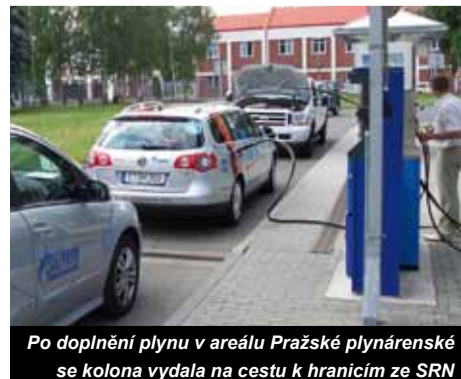
Po doplnění plynu v areálu Pražské plynárenské se kolona vydala na cestu k hranicím ze SRN