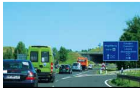
Na dálnici z Lipska do Wolfsburgu