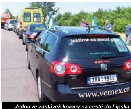
Jedna ze zastávek kolony na cestě do Lipska