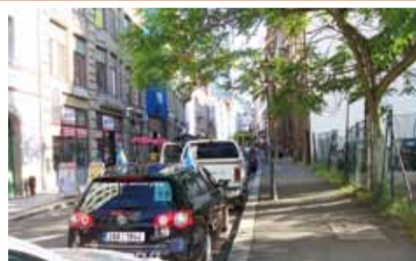
Kolona před hotelem Novotel Lipsk City v Lipsku