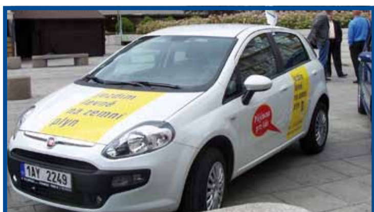
Pražská plynárenská, a. s. měla v sedmidenní štafeté CNG vozidel Modrý koridor, která se vydala z Prahy do Greifswaldu po slavnostním startu v závěru prvního dne jednání 14. Evropského obchodního kongresu v Praze, svého zástupce – CNG model vozu Fiat.