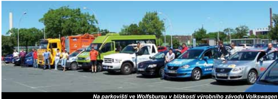
Na parkovišti ve Wolfsburgu v blízkosti výrobního závodu Volkswagen