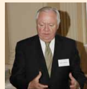
Björn Stigson, prezident WBCSD

Pod záštitou České manažerské asociace byla 26. dubna v Praze v rámci Dne úspěšných manažerů a firem slavnostně podepsána dohoda o založení české pobočky World Business Council for Sustainable Development – Světové podnikatelské rady pro udržitelný rozvoj. Česká pobočka je se tak stala 64. v pořadí a český business se tímto přihlásil k zásadám RIO +20.