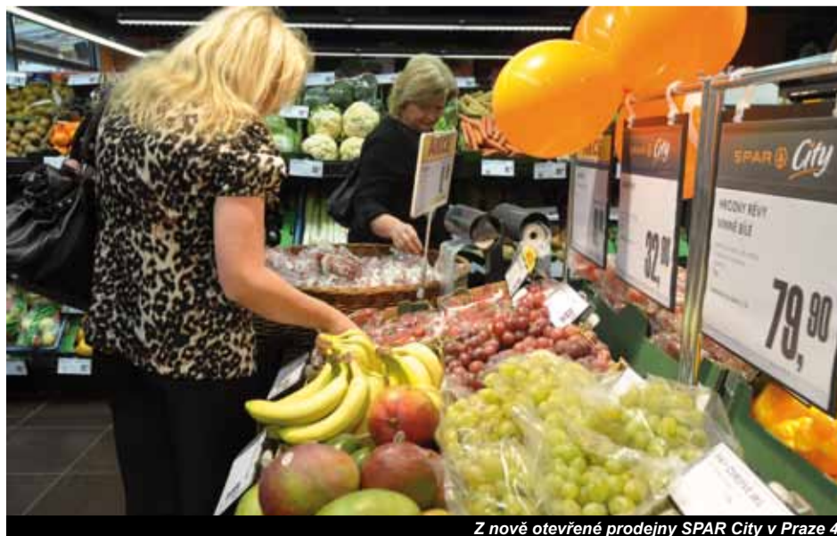
Z nově otevřených prodejen SPAR City v Praze 4

(Assessment Centrum (AC) je speciální diagnostická metoda, která se používá pro výběr zaměstnanců z většího počtu uchazečů. Účastníci jsou hodnoceni v konkrétních situacích, které simulují reálné problémy – rozhodují se, vytvářejí tým a vzájemně komunikují. To umožňuje poznat účastníka z mnoha úhlů, a vytvořit si tak komplexní náhled.)