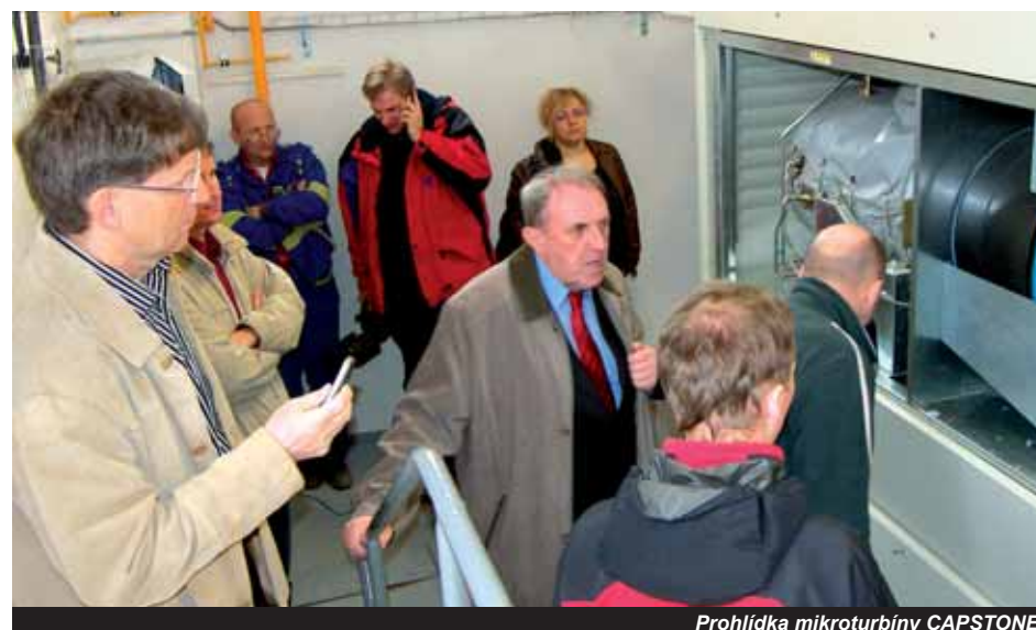
Prohlídka mikroturbíny CAPSTONE