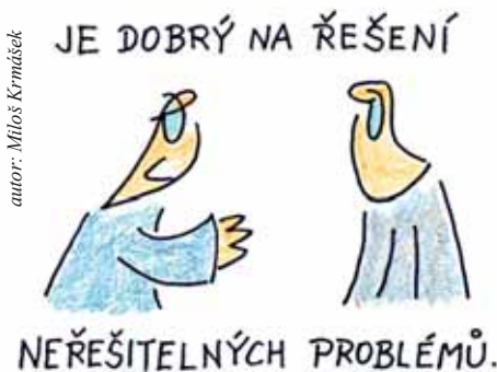
autor: Miloš Krmáček